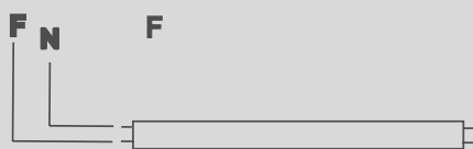
TIPO DE CONEXIÓN